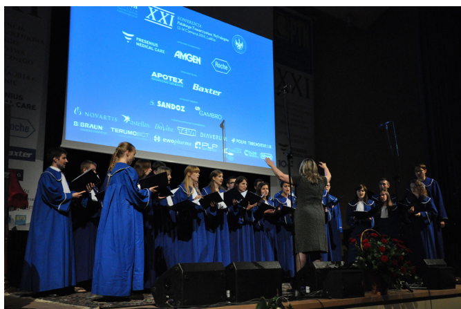
Rycina 6 Chór Uniwersytetu Medycznego w Lublinie. Medical University Choir from Lublin