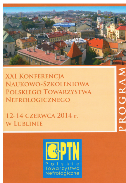
Rycina 2 Strona tytułowa programu XXI Konferencji Naukowo – Szkoleniowej PTN w Lublinie w 2014 roku.

Title page of the programme of the 5 th Congress of the Polish Society of Nephrology in Lublin in 1995.