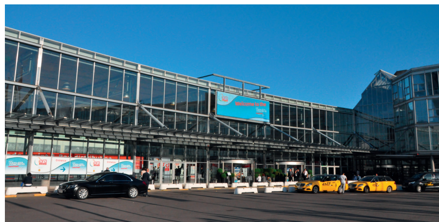
Rycina 1 Centrum Kongresowe „Bella Center” w Kopenhadze. Congress Center „Bella Center” in Copenhagen.

ło, że opuściliśmy pierwszą dziesiątkę krajów najliczniej uczestniczących w Kongresie. Pomimo tego, Kongresy ERA-EDTA są nadal najpopularniejszymi wydarzeniami nefrologicznymi wśród polskich nefrologów i takimi pozostaną przez kolejne lata. Warto zaznaczyć, że coraz więcej uczestników pochodzi z poza Europy. Wszystkie wydarzenia związane z Kongresem odbywały się w znanym centrum kongresowym Bella Center (Ryc. 1) [1,2].