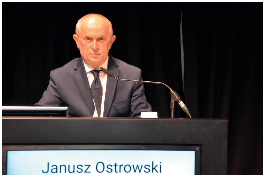
Rycina 3 Autor publikacji jako współprzewodniczący sesji. The author of the publication as a co-chairman of the session.